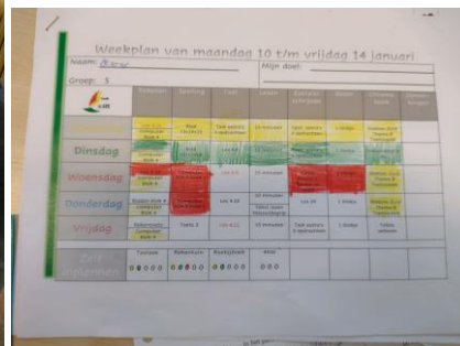
Het werken met het weekplan wordt goed opgepakt!