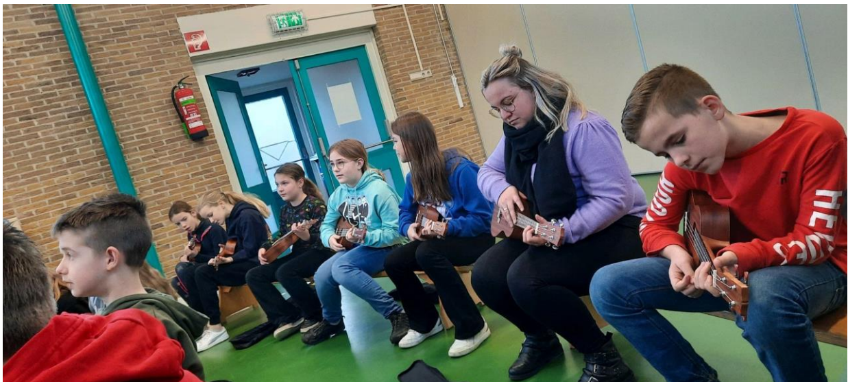
Ukelele les in 6-7-8

Met vriendelijke groet, Cokky Schults-van Goch