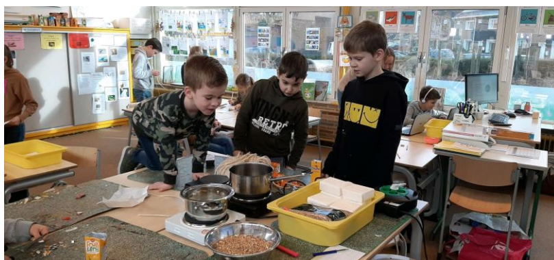
Vetbollen maken in 3-4-5